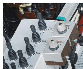
內撐臺高低位置顯示器 Support platform height within their display