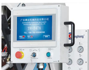
電器箱控制系統 Electrical box control system

※ The description and features mentioned on the catalogues are binding any change mayde made without notice.