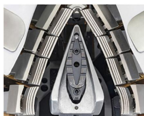
尖頭鞋亦可完美成型 Tip shoes can also form perfectly