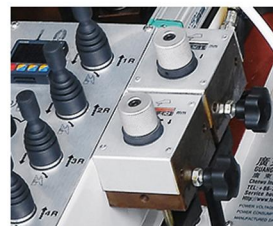
內撐臺高低位置顯示器 Support platform height within their display