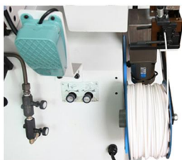
自動上膠系統 Automatic Cementing

※ 本公司保有隨時變更設計之權利，不另通知。 ※ The description and features mentioned on the catalogues are binding any change mayde made without notice.