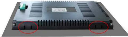
图中红色位置为卡扣安装孔 上图为俯视图，HMI底部有同样两组卡扣安装孔

第一步：将HMI嵌入到所开的孔中； Step.1: Embed the HMI in the hole;