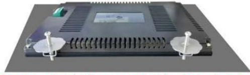
The mounting holes are marked by the red circles. The picture above shows the top view ,there are the same mounting holes on the other side.

第二步：如图所示，将卡扣置入安装孔中； Step.2 : Place the buckles into the mounting holes as shown;